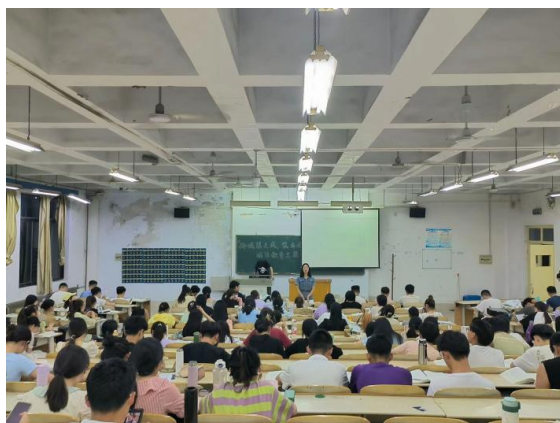
“扬诚信之风，筑应考佳绩”诚信教育主题班会

古人云：“人无信而不立。”诚信考试不仅是对知识的尊重，更是个人责任感和道德品质的体现！数学与大数据学院利用宣传海报、宣传展板等形式，充分宣传诚信应考理念，严肃考风考纪，签署《“学海无涯，诚信为舟”——诚信应考承诺书》，鼓励同学们诚信应考，以诚信考试为荣，以徇私舞弊为耻，用真实的成绩展现自己的学术水平 平和道德水平，展现自己的实力。