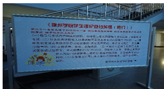
宣传海报、宣传展板