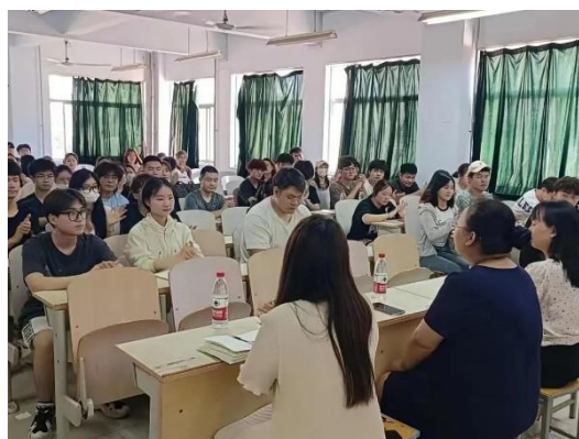
召开诚信考试动员会暨安全教育大会