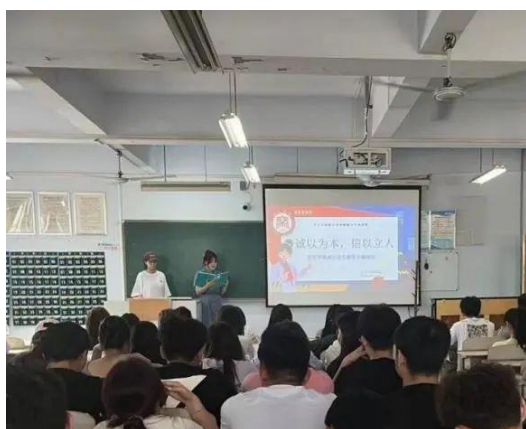
“诚以为本，信以立人”诚信应考主题教育活动