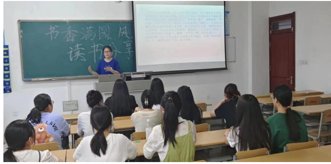
“书香满园 风雅自来”分享活动现场