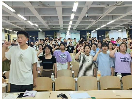
“学风建设我先行”诚信应考宣誓